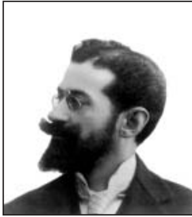
Δημήτριος Λαυράγκας. Ο ιδρυτής του θιάσου «Ελληνικό Μελόδραμα» είχε αναπτύξει στενή σχέση με τη Σμύρνη.

Στα πλαίσια του προγράμματος «Ελληνικές Μουσικές Γιορτές» (Στ' κύκλος) που οργάνωσε για μια ολόκληρη εβδομάδα στο Μέγαρο Μουσικής Αθηνών (αίθουσα Τριάντη) η Κρατική Ορχήστρα Αθηνών, παρουσιάστηκε στις 23 Απριλίου 2010 σε πρώτη παγκόσμια εκτέλεση η «Φρόσω», λυρικό μελόδραμα σε τρεις πράξεις του Διονυσίου Λαυράγκα, υπό τη μουσική διεύθυνση του Βύρωνα Φιδετζή, με εξέχοντες σολίστες και τη χορωδία της Ε.Ρ.Τ. Προηγήθηκε αποκατάσταση-προετοιμασία του μουσικού υλικού από τον μουσικολόγο Γιάννη Τσελίκα και τον Βύρωνα Φιδετζή.