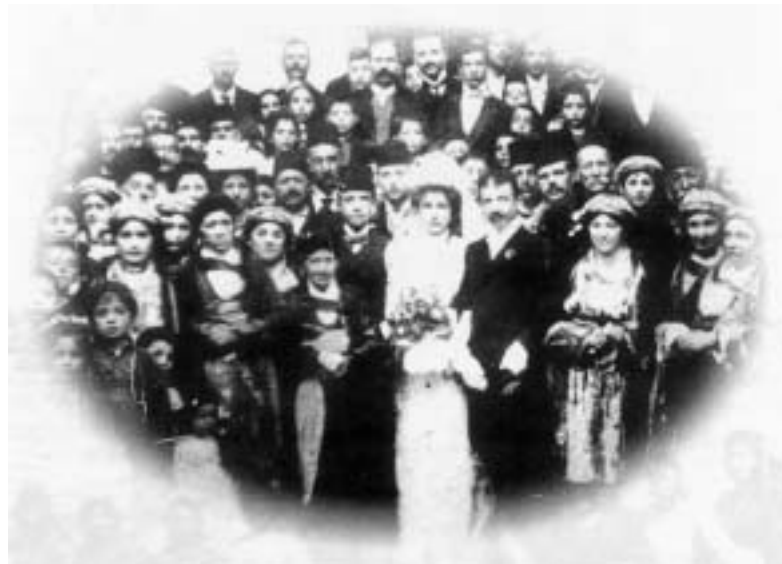
Γάμος στην Καππαδοκία (Φωτό από το βιβλίο του Κωνσταντίνου Μ. Νύδελη, Καππαδοκία, Δρόμους γάμου, ΚΑΕΚΠΠ Δήμου Συκεών, Κέντρο Ιστορίας, σ. 31).

Η γυναίκα της Καππαδοκίας, που παντρευόταν συνήθως σε πολύ μικρή ηλικία, κατοικούσε πάντοτε στο σπιτικό του συζύγου της, ως ένα ακόμη μέλος μιας πατριαρχικής οικογένειας, που συμβίωνε κάτω από την ίδια στέγη. Φτάνοντας μετά τη γαμήλια τελετή στο σπίτι του γαμπρού έπρεπε να φιλήσει το κατώφλι της πόρτας της νέας της διαμονής και αμέσως έπειτα το χέρι του