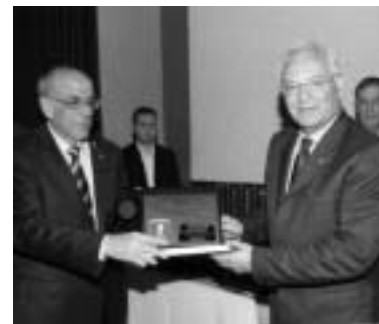
Επίδοση των τιμητικών διακρίσεων του ΣΕΕΘΑ από τον πρόεδρό του αντιστράτηγο ε.α. κ. Γεώργιο Λιάκουρη στον στρατηγό ε.α., επίτιμο αρχηγό ΓΕΕΘΑ και ακαδημαϊκό κ. Δημήτριο Σκαρβέλη (αριστερά) και στον αντιστράτηγο ε.α., επίτιμο διοικητή Γ' Σ.Σ. και τέως πρόεδρο του ΣΕΕΘΑ κ. Ευάγγελο Τσίρκα (δεξιά).

Αμέσως μετά την ανάγνωση του μηνύματος του αναπλ. υπουργού Εθνικής Αμύνης κ. Πάνου Μπεγλίτη, ακολούθησε η παρουσίαση του Χρονικού του Συνδέσμου από την καθηγήτρια της ΣΣΕ κ. Ευαγγελία Καζάνα και η παρουσίαση του βιβλίου «Ιχνηλατώντας το χθες» με άρθρα του αείμνηστου υποστρατήγου Ιωάννου Μπακού-