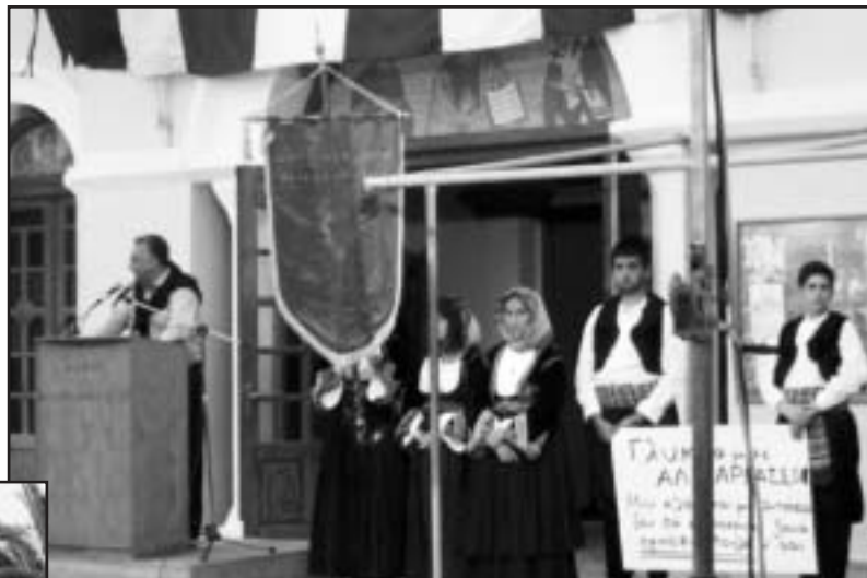
«Γλυκιά μας Αλικαρνασσοῦ! / Μην κλαις και μη λυπάσαι/ δεν θα σ' αφήσουμε ξανά/ προσφυγοπούλα νάσαι». Με πρωτότυπο τρόπο νέοι και νέες του Πολιτιστικού Συλλόγου «Αρτεμισία» εκφράζουν την αντίθεσή τους για τη συνένωση της Αλικαρνασσοῦ με το Δήμο Ηρακλείου κατά την εκδήλωση διαμαρτυρίας των κατοίκων (ένθετη φωτο).

Σύλλογος Λαυρίου «Η Μικρασία», Ένωση Μικρασιατών Πειραιά, Πολιτιστικός Σύλλογος Μικρασιατών Ανατολικής Αττικής, Ένωση Μαγνησίας Μ. Ασίας, Σύλλογος Μικρασιατών Σκάλας Λουτρών Λέσβου «Το Δελφίνι», Πολιτιστικός Μορφωτικός Σύλλογος Γέροντα Καβάλας «Ο Διδυμαίος Απόλλων», Σύλλογος Μι-