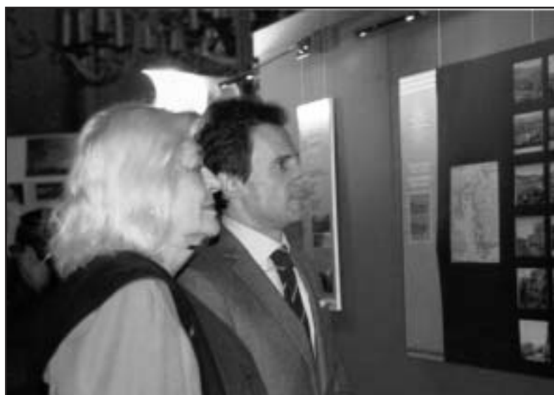
Επισκέπτες της έκθεσης περιεργάζονται τις φωτογραφίες της ελληνικής Σμύρνης στο Ινστιτούτο Φιλοσοφικών Σπουδών της Νάπολης.

Το φθινόπωρο του 2010 θα οργανωθεί, πάντα στη Νάπολη, από το κ. Γιάννη Κορίνθιο και τον κα-