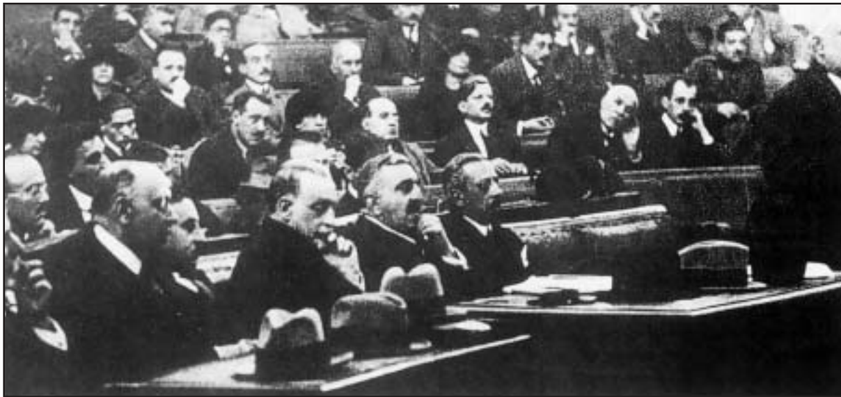
Οι κατηγορούμενοι για τη Μικρασιατική Καταστροφή στην αίθουσα του Στρατοδικείου. Από αριστερά Μ. Γούδας, Γ. Μπαλατζής, Ξ. Στρατηγός, Δ. Γούναρης, Ν. Στράτος, Ν. Θεοτόκης και Π. Πρωτοπαπαδάκης.

Η δήλωση παράστασης πολιτικής αγωγής της ΟΠΣΕ έγινε τυπικά δεκτή κατόπιν εντολής του Εισαγγελέα του Αρείου Πάγου κ. Τέντε, αφού προηγουμένως είχε αντιμετωπισθεί με επιφυλάξεις από τον εισαγγελέα της έδρας κ. Τσάγγα. Ο πληρεξούσιος δικηγόρος της ΟΠΣΕ κ. Κων. Κατερινόπουλος υποστήριξε ότι πρέπει να την ισότητα των όπλων να ακουστούν και οι θέσεις της Ομοσπονδίας γιατί αυτό επιβάλλει το άρθρο 4 του Συντάγματος και η Ευρωπαϊκή Σύμβαση Δικαιωμάτων του Ανθρώπου (αρχή της δίκαιης Δίκης), ενώ ζήτησε και ολιγοήμερη αναβολή για να θέσει υπόψη του δικαστηρίου