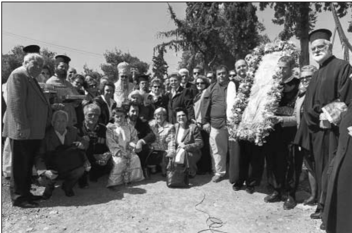
Νεο-παλατιανοί άνδρες και γυναίκες με το μητροπολίτη Προικοννήσου κ. Ιωσήφ και την εικόνα και τα οστά του Αγίου Τιμοθέου που οι πρόγονοί τους διέσωσαν κατά τη Μικρασιατική Καταστροφή.

Τελικά ο Άγιος Τιμόθεος – Αη Τιμόθη τον αποκαλούσαν οι Προικοννησιώτες, που πίστευαν ότι τους προστάτευε από τις θέρ-