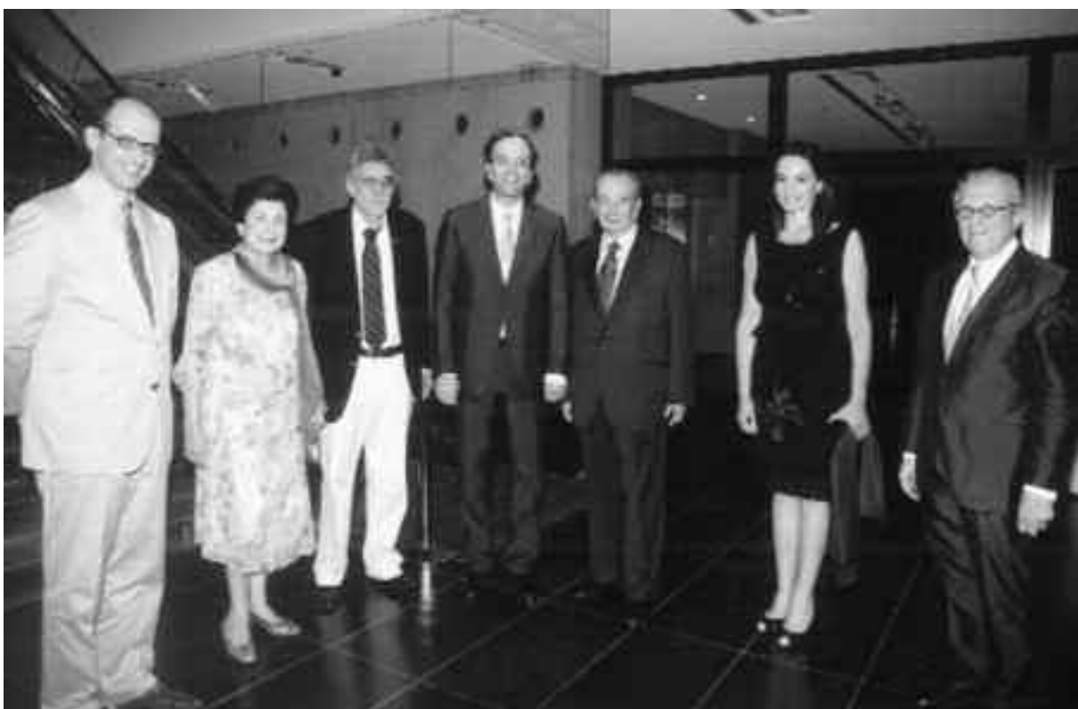
Αναμνηστική φωτογραφία από την εκδήλωση της Ενώσεως Φίλων της Ακροπόλεως. Από αριστερά, ο γεν. γραμματέας του ΥΠΠΟ κ. Θεόδωρος Δραβίλλας, η αντιπρόεδρος της Ενώσεως Φίλων της Ακροπόλεως κ. αΑλκησις Χωρέμη, ο έφορος της Ακροπόλεως κ. Αλέξανδρος Μάντης, ο υπουργός Πολιτισμού κ. Αντώνης Σαμαράς, ο πρόεδρος της Ενώσεως Φίλων της Ακροπόλεως κ. Μανώλης Βασ. Νειάδας, η κυρία Γεωργία Αντ. Σαμαρά και ο καθηγητής κ. Δημήτρης Παντερμαλής.