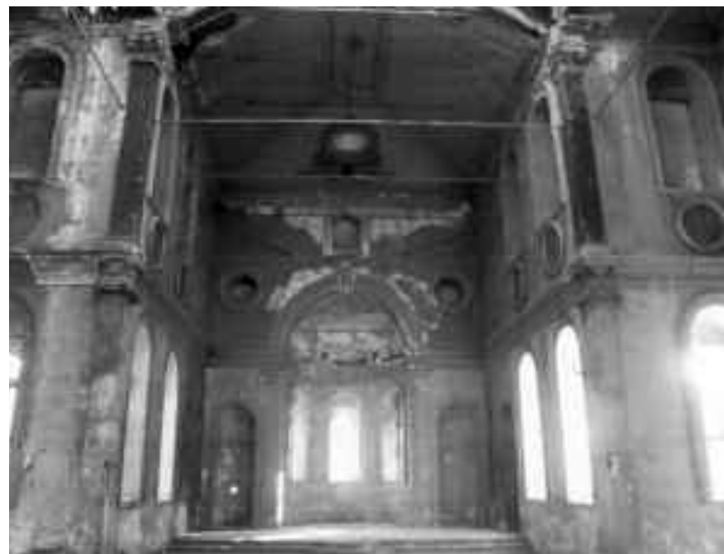
Το Ιερό Βήμα στο ναό του Αγίου Βουκόλου της Σμύρνης, τον Οκτώβριο του 2008.

Η ίδια εφημερίδα με τίτλο «Ο Ατατούρκ τον μετέτρεψε σε μουσείο» γράφει ότι ο Ναός του Αγίου Βουκόλου οικοδομήθηκε κατά το β' ήμισυ του 19ου αιώνα από τη ρωμαϊκή ορθόδοξη κοινότητα της Σμύρνης και παρέμενε στις μνήμες ως η μοναδική ρωμαϊκή Εκκλησία η οποία διασώθηκε από τις πυρκαγιές του 1922. Το εν