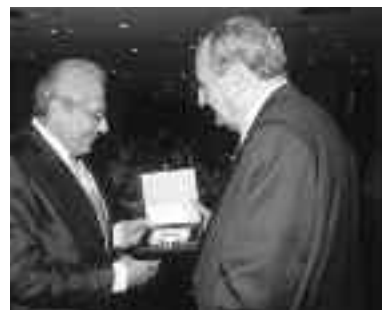
Πάνω: Ο κ. Δημήτρης Παντερμαλής με τον Υπουργό Πολιτισμού κ. Αντώνη Σαμαρά.