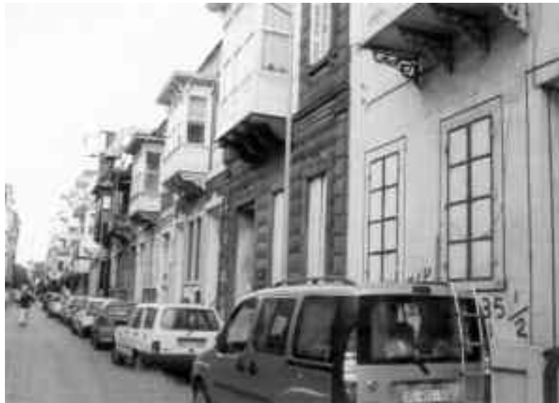
Το Μπουλεβάρ Αλλιότι στην Πούντα.

τρίδες, στους τόπους αυτούς που ζούσαν σιωπηλά μέσα στο αίμα της. Κι έκανε ένα βήμα προς τα εκεί. Και πάλι πισωγύριζε. «Άραγε θα μπορούσε ν' αντέξει την πίκρα ενός τέτοιου ταξιδιού;»