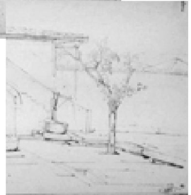
Δεξιά: Σχέδιο σμυρναϊκής οικίας, Montfort 1837

γράφος ο οποίος έμαθε να μιλάει αραβικά, ντυνόταν όπως οι ντόπιοι, ταξίδευε με τα καραβάνια και κοιμόταν σε σκηνή. Οι μελέτες του είναι τίμια, αντικειμενικά ρεπορτάζ, όχι ηρωικά και αποδίδουν μία σωστή εικόνα ανάμεσα στους υπόλοιπους Οριενταλιστές ζωγράφους».