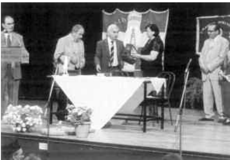
Ανταλλαγή αναμνηστικών από τις αντιπροσωπείες των δύο αδελφών μικρασιατικών σωματείων.

ντων της μάχης του Κιλκίς κατά του Βαλκανικού Πολέμου του 1912-13, υπήρξε ιδιαίτερα επικοδομητική για τους επισκέπτες από τη Χίο που πληροφορήθηκαν πως οι συμπατριώτες τους, κυρίως Αναβατούσοι και Αυγωνυμούσοι, έπαιξαν καθοριστικό ρόλο στη μεγάλη νίκη του ελληνικού στρατού στο Κιλκίς.