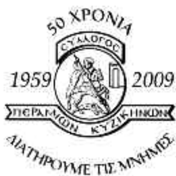
Ο λογότυπος για τα 50 χρόνια του σωματείου.

θωτικού Συνδέσμου των Περαμίων της Κωνσταντινούπολης» και διατηρεί τη μνήμη της αξέχαστης μικρασιατικής πατρίδας, με έδρα από το 1988 τη Νέα Πέραμο στη Μεγαρίδα, τον τόπο στον οποίο ρίζωσαν οι Μικρασιάτες πρόσφυγες της Περάμου και των άλλων χωριών της Κυζικηνής χερσονήσου.