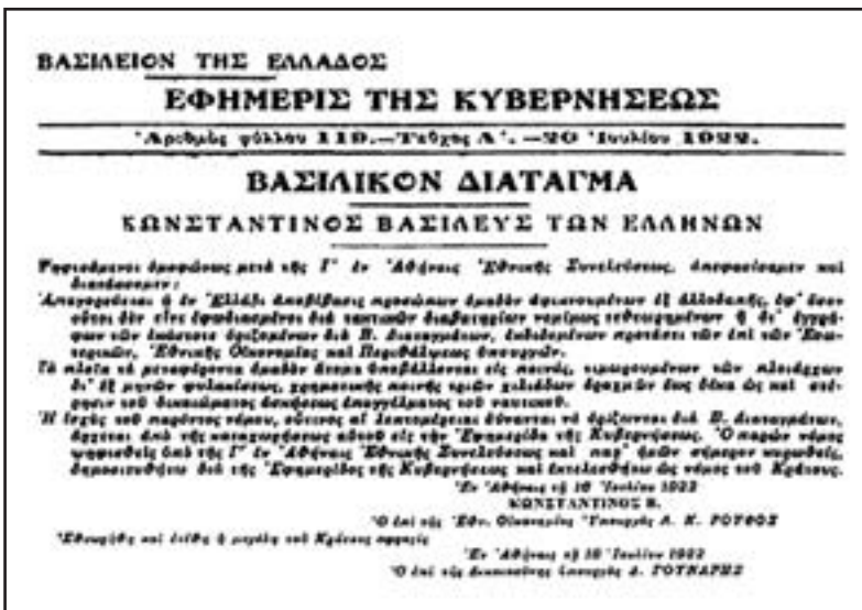
Το Βασιλικό Διάταγμα της 18ης Ιουλίου 1922 με το οποίο το Κράτος των Αθηνών απαγόρευε την είσοδο των Μικρασιατών στην Ελλάδα, παραδίδοντας ουσιαστικά χιλιάδες Έλληνες της Ανατολής στα χέρια του Κεμάλ.

Στην πραγματικότητα δεν θα πρόκειται για μια νέα ακροαματική διαδικασία. Απλώς, ύστερα από τη θέση που έλαβε η Ολομέλεια του Αρείου Πάγου, θα συνεδριάσει το Ποινικό Τμήμα του Ανωτάτου Δικαστηρίου, το οποίο θα επανεξετάσει τα στοιχεία που οδήγησαν στην εκτέλεση των Έξι και θα αποφασίσει για το «διά ταύ-