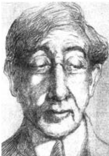
Κ. Π. Καβάφης (1863 – 1933). Χαλκογραφία του συμπατριώτη του Γιάννη Κεφαλληνού.

Όμως, παρόλο που οι Θεοί «την γη της Ιωνίας αγαπούν και ενθυμούνται ακόμη», τα περισσότερα «Μικρασιατικά» ποιήματα του Καβάφη αναφέρονται στην απομονωμένη και πολύπαθη Καππαδοκία. Το ζωηρό ενδιαφέρον του ποιητή γι' αυτήν θα ήταν δύσκολο να ερμηνευτεί, αν δεν είχαμε τη μαρτυρία του ίδιου για την εξαιρετική ευχαρίστηση και το μεγάλο θαυμασμό που του προκάλεσε η ανάγνωση της βιογραφίας του Καππαδόκη νεοπυθαγόρειου σοφού Απολλώνιου του Τυανέα, γραμμένη από το σοφιστή Φλάβιο Φιλόστρατο. Όπως αναφέρει σε άρθρο του 2 , « Η μορφή του μεγάλου μάγου φιλοσόφου των Τυάνων γοητεύει το πνεύμα ως μεγαλοπρεπής υπεράνθρωπος προσωπικότητας [ ... ]