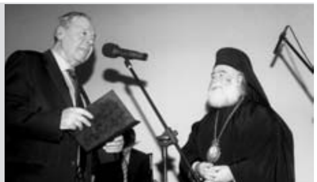
Ο πρόεδρος της Μικρασιατικής Στέγης Περιστερίου «Ο Άγιος Χρυσόστομος Σμύρνης» κ. Βασ. Τσιβίσκος προσφωνεί τον Πατριάρχη Αλεξανδρείας κ. Θεόδωρο.

Την εκδήλωση ευλόγησε ο Πατριάρχης Αλεξανδρείας κ. Θεόδωρος διά εμπνευσμένης προσλαλιάς του, και απηύθυναν χαιρετισμό ο υφυπουργός Παιδείας, ο Δήμαρχος Περιστερίου και ο πρόεδρος της Μικρασιατικής Ένωσης Περιστερίου κ. Βασίλειος Τσιβίσκος, ο οποίος προσέφερε στον Προκαθήμενο της Αλεξανδρινής Εκκλησίας ως αναμνηστικό δώρο, ένα στυλογράφο, με την ευχή να υπογράψει με αυτό πολλά ακόμη εγνωσμένης αξίας έργα, όπως την επανέκδοσή της μετάφρασης της Καινής Διαθήκης. Πρόκειται για την