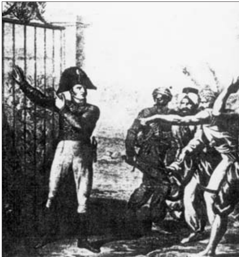
Ο Γάλλος πρόξενος Πιέρ Νταβίντ απέναντι στους φανατισμένους μουσουλμάνους (Γκραβούρα εποχής).

Στα τέλη του Απριλίου του 1821 απαγορεύτηκαν όλες οι αναχωρήσεις των Ελλήνων από τη Σμύρνη, επειδή οι Τούρκοι υποπτεύονταν ό-