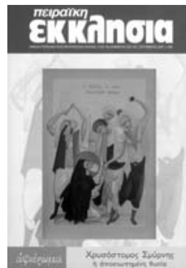
Το εξώφυλλο του περιοδικού «Πειραιϊκή Εκκλησία» για το αφιέρωμα «Χρυσόστομος Σμύρνης η αποσιωπημένη θυσία».

Η μεταθανάτια αναγνώριση του αγίου Χρυσοστόμου Σμύρνης από τους καθολικούς χριστιανούς αδελφούς μας ενέχει ιδιαίτερη σημασία. Είναι η πρώτη, ίσως φορά, που το επίσημο δημοσιογραφικό όργανο των Ελληνορθόδοξων Καθολικών Ελλάδος αποκαλεί τον τελευταίο ορθόδοξο ιεράρχη της Σμύρνης όχι μόνο «εθνομάρτυρα», [...] αλλά και «μεγάλο ιερομάρτυρα», εκφράζοντας έτσι το βαθύτατο σεβασμό τους προς τη μνήμη του.