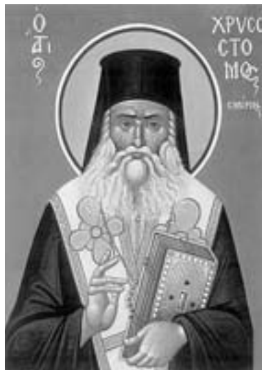
Ο άγιος Χρυσόστομος Σμύρνης. Τοιχογραφία του Σπυριδώνος Βαλασαμή

ρησε το 1922, ο Πινώ απευθύνεται κυρίως στους Γάλλους και επιδιώκει να ενημερώσει αντικειμενικά το γαλλικό κοινό για τους υπεύθυνους και τα αίτια του ολοκαυτώματος της ιωνικής πρωτεύουσας. Μέσα από τις αφηγήσεις αυτοπτών μαρτύρων