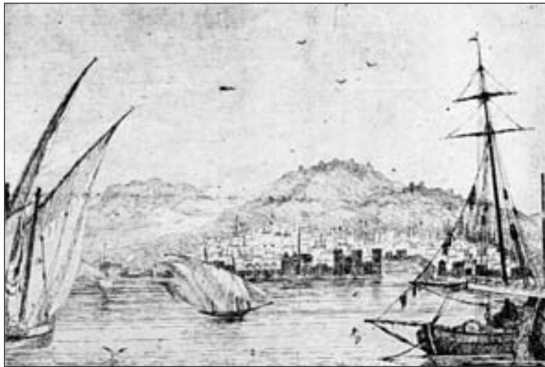
Το παλιό λιμάνι των Γαλερών της Σμύρνης.

μνημονεύματα δημοσιεύθηκαν εσχάτως. Αφηγείται κι' αυτός για «τις σφαγές που έγιναν με θύματα τους Έλληνες που έτυχε να βρίσκονται στους δρόμους την ώρα που έφταναν στα αντιά των Τούρκων δυσάρεστες ειδήσεις από τους στασιαστές ή όταν ξεσηκώνονταν για άλλους λόγους εναντίον των Ελλήνων. Κατά τη διάρκεια ενός τέτοιου περιστατικού ... αναζήτησα άσυλο και όντως μου το παρέιχαν στο σπίτι του Γάλλου κονσόλου, όπου εκατοντάδες από τους αδελφούς μου σε διαφορετικές περιόδους βρήκαν καταφύγιο και ασφάλεια» 3 . Όταν ήρθε η στιγμή να αναχωρήσει και ο Πέτρος Μέγγος για να έρθει στην Ελλάδα και να αγωνιστεί στις τάξεις των επαναστατημένων Ελλήνων, ο Γάλλος πρόξενος τον εφοδίασε με διπλωματικό διαβατήριο, στο οποίο τον εμφάνιζε ως δήθεν σύζυγο κάποιας γυναίκα την οποία και συνόδευσε μαζί με τα παιδιά της στο ταξίδι έξω από την Τουρκία, σώζοντας με αυτό τον τρόπο και αυτήν και τα παιδιά της. Αλλά ποιος ήταν ο Γάλλος Πρόξενος που με την αποφασιστική και γενναία στάση του αναδείχτηκε σε σωτήρα των Ελλήνων της Σμύρνης; Ο Πιερ Νταβίντ γεννήθηκε το 1771 στην κωμόπολη Φαλαίς της Νορμανδίας και μετά τις σπουδές που έκανε στο Παρίσι, ασχολήθηκε με τη δημοσιογραφία ως συντάκτης της εφημερίδας Moniteur Universel . Προσελήφθη στη συνέχεια στο Υπουργείο Εξωτερικών και απέσπασε την