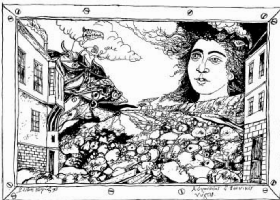
Αυγουστής ή Ιωνικές νύχτες. Ζωγραφιά του Ράλλη Κοψίδη από το βιβλίο της Μαρίας Βεινόγλου «Το Μεγάλο Πλοίο - Αφηγήματα για τη δική μας Ανατολή», Αθήνα 1994.

από τη ζωή ο μεγάλος συμπατριώτης μας ο ζωγράφος, χαράκτης και συγγραφέας, ο κυρ Ράλλης Κοψίδης. Μισός Καππαδόκης και μισός Ανατολικοθρακιώτης στην καταγωγή, διατηρούσε ευδιάκριτη στο κύτταρό του την Μικρασιατική εγγραφή. Την αποτύπωσε πολλαπλά στο έργο του, στους «διαλόγους» που μόλιμα εγκαθιστά μες στις εικόνες του, στο ύφος του, στις αμφιβολίες και ιδιαίτερα στις λύπες του, ιδίως σε όσα η προσφυγική Ρωμιοσύνη πίστευε και οραματιζόταν. Ακόμα κι η επιλογή του ζωγραφικού «ύφους» της τόσο ιδιαίτερης «Παιδικότητας» – απόλυτα συνειδητή στον Κοψίδη, και... κάθε άλλο παρά ναϊφ – πιστεύουμε πως αναδύεται από την απaráγραφτη εκείνη εγγραφή (τραυματική κι ονειρική) ενός παιδιού προσφύγων... Από την λαϊκή και θρησκευτική παράδοση ενός πολύ μεγάλου, πολιτισμικού χώρου που έχει κληρονομήσει.