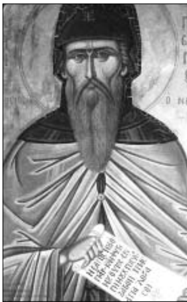
Ο Άγιος Γεώργιος ο Νεαπολίτης. Εικόνα τέμπλου. Έργο Φωτίου Κόντογλου στο Ναό του Αγίου Ευσταθίου Νέας Ιωνίας (Αττικής), όπου φυλάσσεται και το χαριτόβρυτο λείψανο του Αγίου.

«Μια φορά, πολύ παλιά, λέγαν πως ήταν στη Νεάπολη ένας παπάς, ο παπα-Γιώργης. Ήταν πολύ καλός παπάς, άγιος παπάς. Γι' αυτό τον φω-