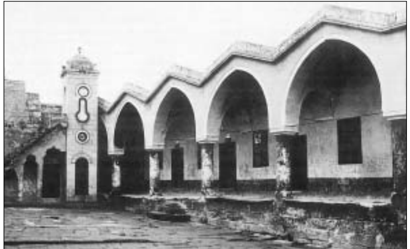
Το Αρρεναγωγείο της Συνασού.

Η γη της Καππαδοκίας φιλοξένησε επί αιώνες έναν Ελληνοχριστιανικό πολιτισμό, που δημιουργήθηκε και αναπτύχθηκε από τους κατοίκους της, κάτω α-