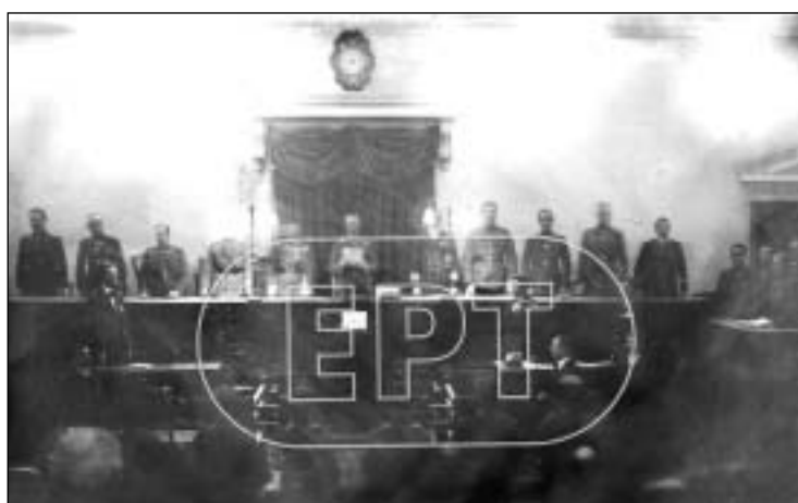
Τετάρτη, 15 Νοεμβρίου 1922. Το τέλος της πολύκροτης «Δίκης των 6». Ο πρόεδρος του Εκτάκτου Επαναστατικού Στρατοδικείου Αθηνών, Αλέξανδρος Οθωναίος, ανακοινώνει την καταδικαστική απόφαση για τους κατηγορούμενους.

Η απόφαση του Ζ' Ποινικού Τμήματος του Α.Π., που συνήλθε σε Συμβούλιο (χωρίς δημόσια συνεδρίαση), εκτιμάται ότι θα δεχθεί οξύτατη κριτική τόσο από ιστορικούς, όσο και από νομικούς. Από την πλευρά της ΟΠΣΕ, ο πρόεδρος της κ. Αθανάσιος Λαγοδήμος με δηλώσεις του στην εφημερίδα «ΤΑ ΝΕΑ» (23/10/2010) μετέφερε την αίσθηση απογοήτευσης των προσφυγικών σωματείων. «Δεν μπορούμε να μιλάμε για αθώωση. Πρόκειται για μια παραγραφή. Η αθώωση νομιμοποιείται μόνο στα μάτια του κόσμου», είπε μεταξύ άλλων ο κ. Λαγοδήμος. ΣΕΛ. 3