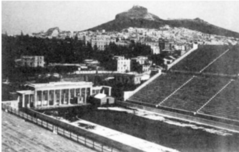
Αποψη του Παναθηναϊκού Σταδίου. Στο «Καλλιμάραρο» αναβίωσε ο στίβος του Πανιώνιου Γ.Σ.Σ. μετά τον βίαιο ξεριζωμό από την πατρίδα.

Συχνά και με εμφανές κίνητρο την ευρεία συναισθηματική φόρτιση, η επέτειος ενός μεγάλου δραματικού γεγονότος καλύπτεται, σε σημαντικό μέρος των όσων γράφονται και ακούγονται, από θρηνολογία ενώ το αντίθετο αξίζει να συμβαίνει. Αυτό αφορά την υπόμνηση, τον σχολιασμό και την προσθήκη νέων εκτιμήσεων, ακόμη και τη γνωστοποίηση νέων ευρημάτων, για την ουσιαστική σημασία και τις επιπτώσεις, θετικές ή αρνητικές, που είχε και πιθανότατα έχει και σήμερα, αλλά θα έχει και αύριο. Με αφετηρία τη θέση αυτή γνώσης, κινήτρου, προβληματισμού και σκέψης – κυρίως για τους νεότερους – η επέτειος του ξεριζωμού του Μικρασιατικού Ελληνισμού και του πρώτου ακρωτηριασμού των Ελλήνων της Ανατ. Θράκης και της Κωνσταντινούπολης πρέπει να μετρηθεί με το τι προσέφερε ως μεγάλη μετάγγιση δυναμισμού στον ελληνικό αθλητισμό. Το πρώτο δίδαγμα αφορά αυτήν ταύτη την έννοια της άθλησης ως κοινωνικής δράσης και ψυχολογικής στήριξης. Αναφερθήκαμε στη μεγάλη μετάγγιση. Μια από τις πρώτες κινήσεις για την επιβίωση του προσφυγικού κόσμου είναι η μεταφύτευση ακόμη και στις παραγκουπόλεις και βέβαια στις κοινότητες και στα α-