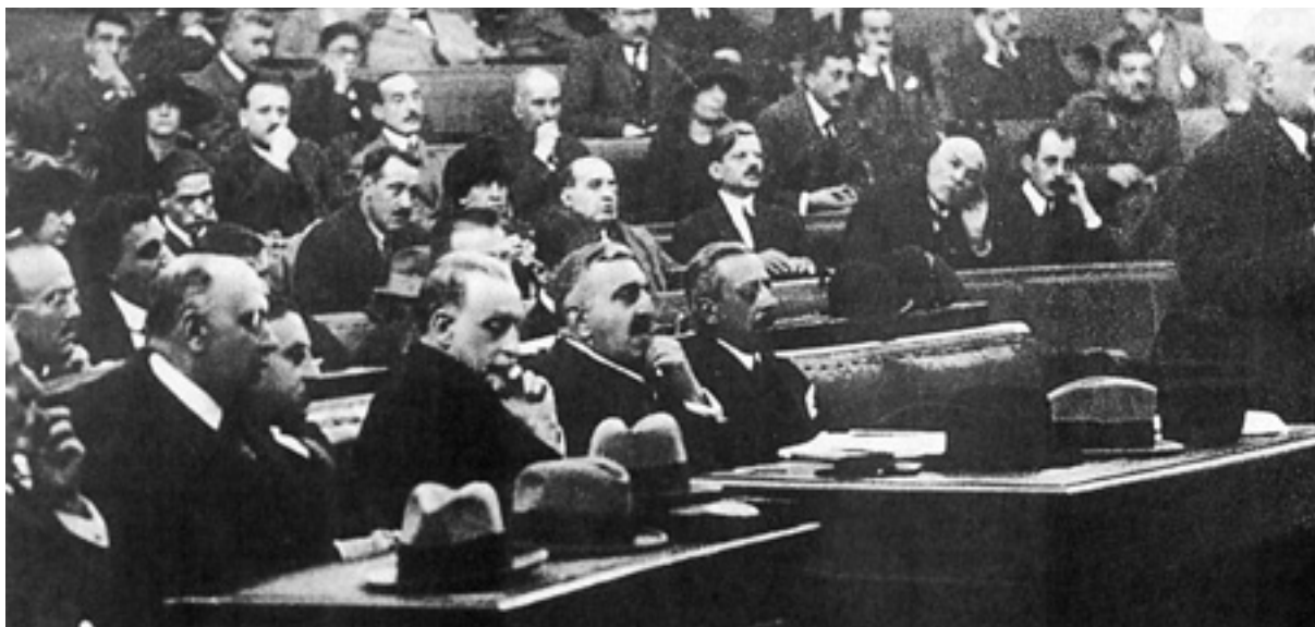
Οι κατηγορούμενοι για τη Μικρασιατική Καταστροφή στην αίθουσα του Στρατοδικείου. Από αριστερά Μ. Γούδας, Γ. Μπαλατζής, Ξ. Στρατηγός, Δ. Γούναρης, Ν. Στράτος, Ν. Θεοτόκης και Π. Πρωτοπαπαδάκης.

Η εκστρατεία για αποκατάσταση των καταδικασθέντων της Δίκης των «Έξι», έχει μια νομική και μια ιστορική διάσταση. Κατά το καθαρά νομικό, δηλαδή το ποινικό σκέλος, η παρέλευση ακόμη και τώσων δεκαετιών δεν εμποδίζει την κίνηση της διαδικασίας αναψηλάφησης σε περιπτώσεις όπου οι κληρονόμοι του καταδικασθέντος επιδιώκουν την αποκατάσταση της μνήμης του προσκομίζοντας νέα στοιχεία. Εν προκειμένω, ωστόσο, δεν φαίνεται να γίνεται λόγος για νέα στοιχεία, παρά μόνο για μεταγενέστερες πολιτικές εκτιμήσεις. Χωρίς νέα αποδεικτικά στοιχεία, όμως, δεν θα μπορούσε να διαλευκανθεί ο βαθμός αμέλειας ή η δυνατότητα πρόβλεψης των αποτελεσμάτων συγκεκριμένων στρατιωτικών ενεργειών, οι δε σύγχρονοι ιστορικοί, δημοσιογράφοι ή στρατιωτικοί εμπειρογνώμονες, αγέννητοι κατά τη στιγμή των κρίσιμων γεγονότων, είναι εξ ορισμού αναριόδοιοι να καταθέσουν τη δευτερογενή επιστημονική γνώση τους ως υποκατάστατα ζώντων μαρτύρων. Επί πλέον, οι ειδικές περιστάσεις υπό τις οποίες είχε εκτυλιχθεί η «Δίκη των Έξι» καθιστούν αδύνατο το να υπεισέλθει ο σημερινός δικαστής