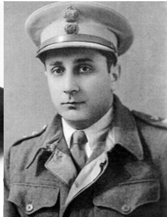
Ο Χρυσόστομος Καλαφάτης

Το 1932 εισήχθη στη Σ.Σ.Ε. από την οποία εξήλθε ανθυπολοχαγός Πυροβολικού το 1936. Διετέλεσε διοικητής της 5ης Πυροβολαρχίας του Α' Συντάγματος Πυροβολικού στο Γουδί. Πήρε μέρος στις επιχειρήσεις του ελληνο-ιταλικού μετώπου και από τα τέλη του 1942 έως το 1945 πολέμησε εναντίον των Γερμανών στη Μέση Ανατολή. Για τη δράση του τιμήθηκε με χρυσό αριστείο ανδρείας και μετάλλια εξαιρετών πράξεων. Αποστρατεύθηκε με το βαθμό του