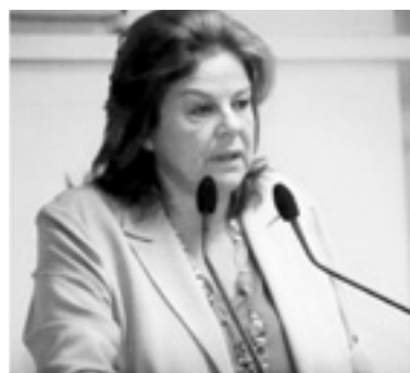
Η μικρασιατικής καταγωγής βουλευτής του ΠΑΣΟΚ κ. Λούκα Κατσέλη, υπουργός Οικονομίας - Ανταγωνιστικότητας και Ναυτιλίας.

Γνωρίζοντας την αγάπη σας για την αξέχαστη μικρασιατική πατρίδα, είμαστε βέβαιοι ότι θα ενδια-