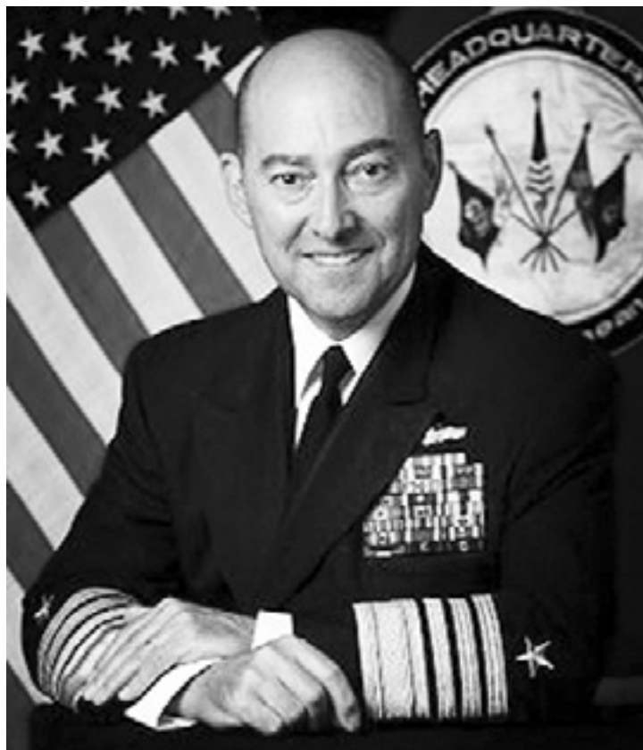
Ο μικρασιατικής καταγωγής ναύαρχος Δημήτρης Σταυρίδης, νέος αρχηγός του ΝΑΤΟ, ελληνοαμερικανός τρίτης γενιάς.

Αξιοσημείωτο είναι ότι την καταγωγή του από τους Έλληνες, όχι μόνο την επικαλέστηκε με ιδιαίτερη υπερηφάνεια στην ακρόασή του στο αμερικάνικο Κογκρέσο για την επιλογή του ως δι-