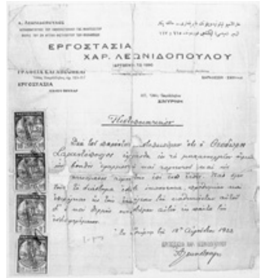
Αντίγραφο συστατικής επιστολής για εργαζόμενο στα εργοστάσια «Χαρ. Λεωνιδόπουλου» στο Χαλκιά-Βουνάρι της Σμύρνης.

Τον πήρα στο τηλέφωνο, βρεθήκαμε, και ακούστε τί προέκυ-